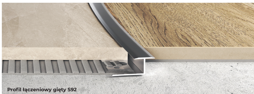
Profil łączeniowy gięty S92