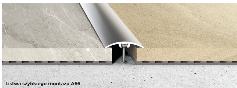
Listwa szybkiego montażu A66