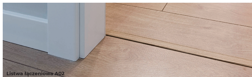
Listwa łączeniowa A02

podczas układania podłogi. Najczęściej dopasowujemy je kolorystycznie do ściany lub podłogi. Profile przypodłogowe pełnią przede wszystkim funkcje dekoracyjne. Ich zadaniem jest również zabezpieczenie łączeń podłogi z innymi płaszczyznami, poprzez ich zasłonięcie i w ten sposób zapobiegnięcie wnikania w nie wody, kurzu i innego typu zanieczyszczeń. Listwy przypodłogowe umożliwiają również zasłonięcie nieestetycznie wystających przewodów.