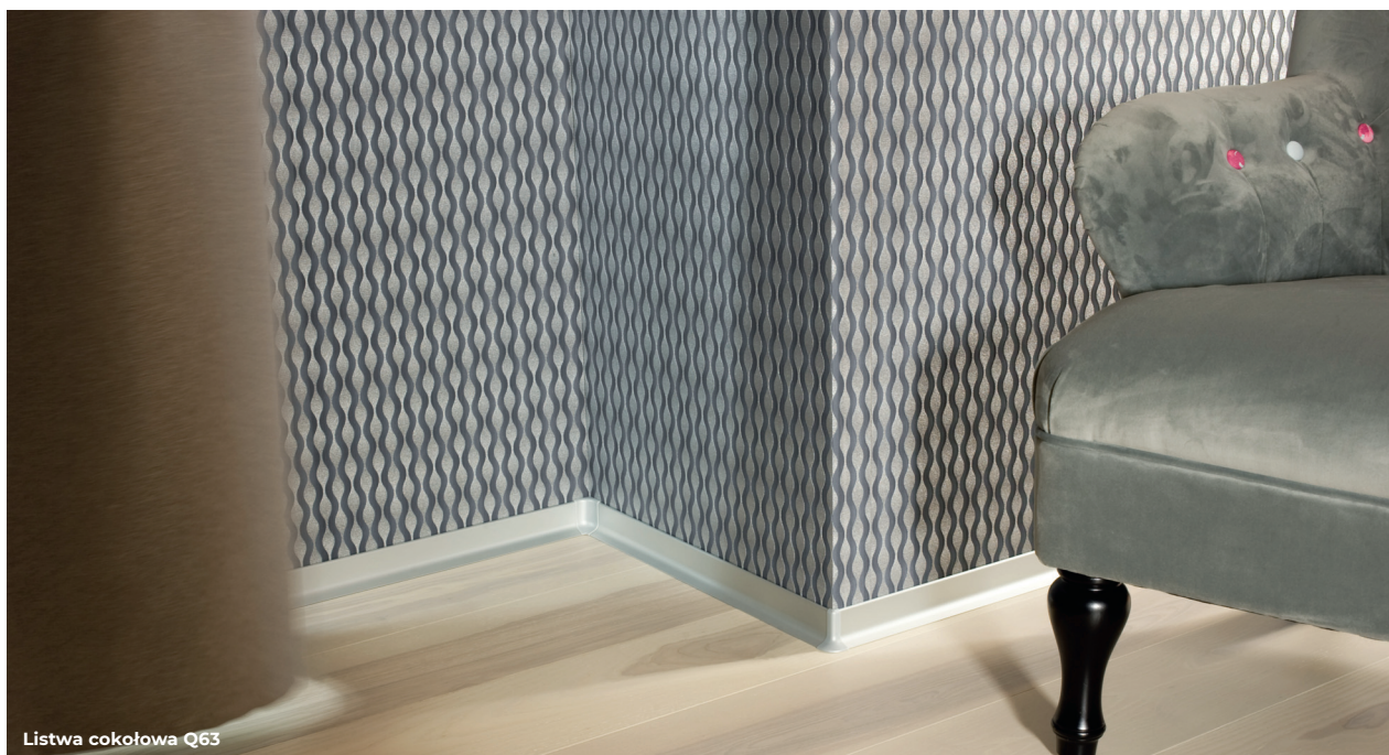
Listwa cokołowa Q63

Nawet z największym smakiem urządzone wnętrze może stracić swój urok, jeśli nie zadamy w nim o drobne detale – listwy wykończeniowe. Od ich rodzaju, kolorystyki i sposobu montażu zależy wygląd, funkcjonalność wnętrza oraz komfort jego użytkowania. Do szerokiej gamy listew wykończeniowych marki Effector należą m.in. listwy łączeniowe, dylatacyjne, przypodłogowe, kształtowniki dla majsterkowiczów oraz pręty schodowe. Szeroki wybór profili oferujemy w internetowym sklepie firmowym: www.sklep.effector.com.pl